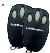
3-Kanal Mini Handsender 94335E