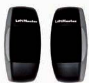
772E Infrarot Sicherheitssensor